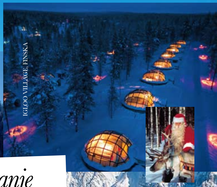
IGLOO VILLAGE, FINSKA