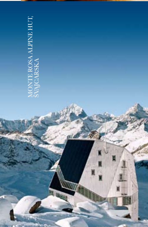
MONTE ROSA ALPINE HUT, ŠVAJCARSKA