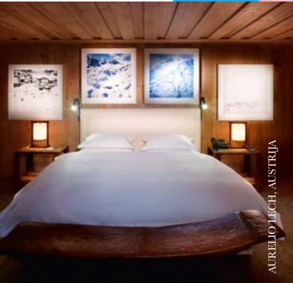
AURELIO LECH, AUSTRIJA