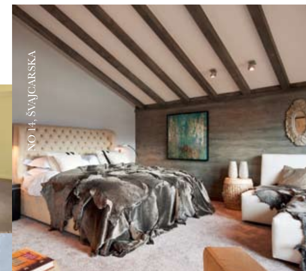
NO 14, ŠVAJCARSKA