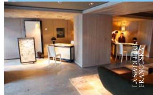
LA SIVOLIÈRE, FRANCUSKA

Kada su prvi posetioци stigli u ovo mesto pre tačno 130 godina, bili su privučeni lepotom netaknute prirode i do današnjeg dana ovo je ostao najčešći razlog posete. Na obali jezera Malmagen, u blizini Arktika, nalazi se najstariji planinski hotel u Švedskoj, koji je kao nekadašnji kraljevski planinski kompleks iz XVIII veka transformisan u moderno utočište sa enterijerom tipičnim za skandinavski stil. Ovde je sve podređeno prirodi, te ćete boravkom ovde iskusiti dramatične prirodne promene, poput šetnje kroz snežnu pustinju ili pak uživanja u polarnoj svetlosti. Istinsku snežnu divljinu možete upoznati vozeći se snowmobilom , drvenim sankama koje vuku haskiji, ili pak cross-country skijanjem. Na ovom mestu sa više od 60 planinskih vrhova i ski-stazama čija dužina prelazi 300 km, svaki dan može biti nova avantura. Relaksacija